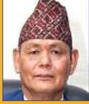
अध्यक्ष माननीय तेजुलाल चौधरी युवा तथा खेलकुद मन्त्री