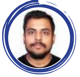
विशाल पन्थ (तस्बिर)