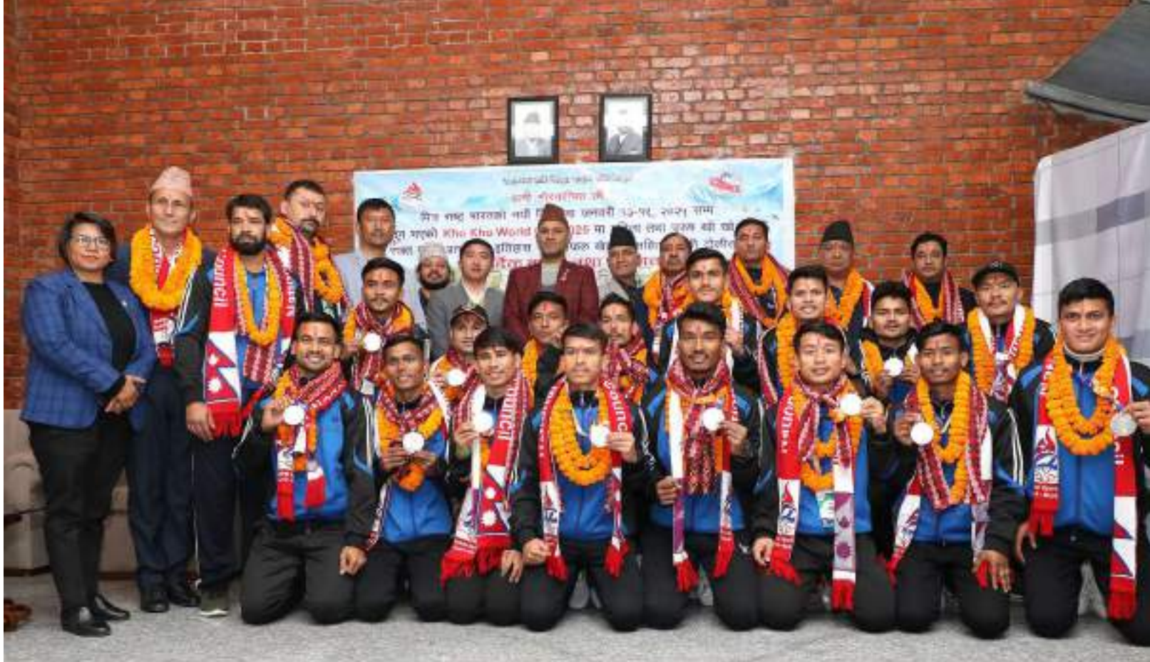
खो खो टिम