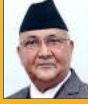
संरक्षक सम्माननीय केपी शर्मा ओली प्रधानमन्त्री